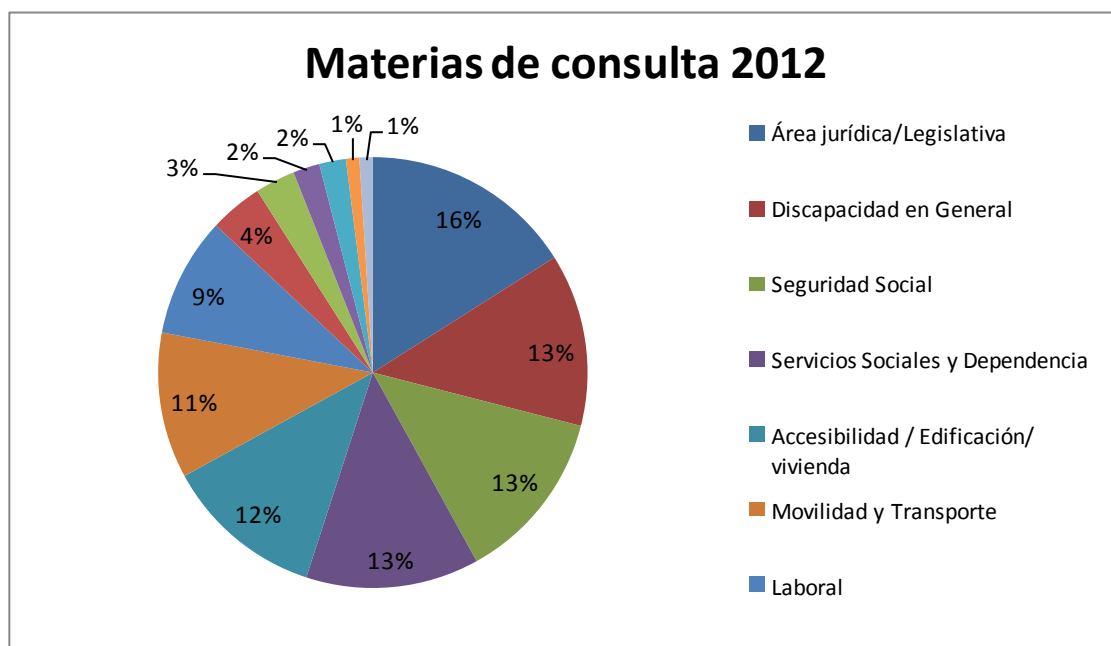
Grafico 2.- materias totales de consulta

Los asuntos que preocupan a nuestros consultantes durante el presente año, como puede comprobarse en la tabla 2, han variado algo con respecto a años anteriores. Inicialmente, podríamos decir que las consultas están más diversificadas que en años anteriores. Un segundo aspecto a destacar sería que, las consultas relacionadas con lo "laboral", materia estrella en el 2011, han descendido de forma muy importante, no solo con respecto a este año 2012, sino también con respecto a años anteriores. Paralelamente a ello, las consultas relacionadas con "seguridad social" suben considerablemente, así como las relacionadas con "discapacidad en general" y "accesibilidad, vivienda/edificación".