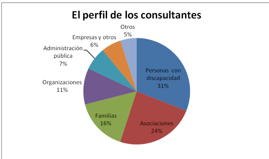
Grafico 1.- perfil de los consultantes

Los tres perfiles que más consultas realizan en el año 2012, como puede observarse en el gráfico 1, son las "personas con discapacidad" (31%), seguido de las "asociaciones" del sector (24%) y sus "familiares" (16%).